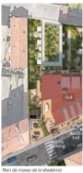
Plan de masse de biodiversité