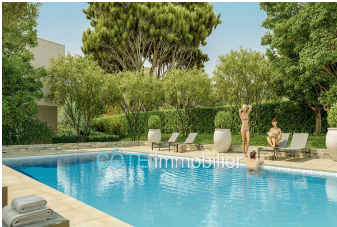
Programme neuf - Convention milancip - MLS Côte d'Azur