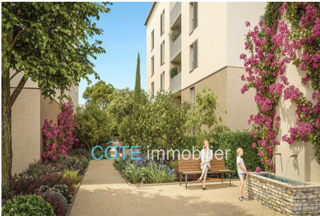
Programme neuf - Convention milancip - MLS Côte d'Azur